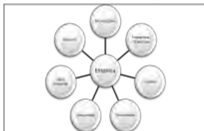
Figura 1 - Stakeholders

Korporativ Sosial Məsuliyyət (KSM) ideyası hüquqi məsuliyyət ideyası, bir səbəb ilə sosial etik mənada məsul davranış, və ya könüllü töhfə fikir və birləşmək kimi ilə bağlı olan, qəbul olunacaq müxtəlif davranışları təşkilatın müşahidə oluna bilər Borger (2001, p. 15) , buna görə də, sosial məsuliyyət hər bir şirkət daxil olan sosial-mədəni kontekstində görə biraz müxtəlif tələbləri ola bilər şirkətlər tərəfindən qarşılanaçaq üçün problemlər geniş dəsti kimi görünür.